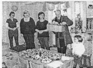
Tag der Offenen Tür am 28.2.2009