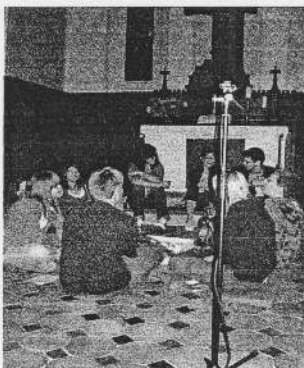
Eure Junge Gemeinde Groitzsch

Also dann auf ein baldiges Kennenlernen in natura!